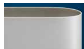
Nastro Ropanyl Premium Plus

Risultati dei test a parità di condizioni di resistenza allo sfilacciamento ed usura: