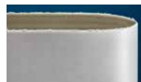
Miglior nastro anti sfilacciamento concorrente