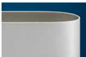
Ropanyl Premium Belt

Résultats des essais d'effilochage / fiabilité * :