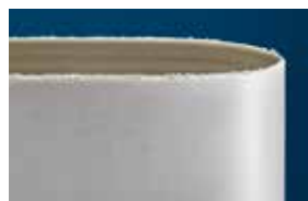
Bande équivalente des principaux concurrents

*Résultats obtenus lors d'essais identiques en laboratoire