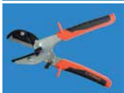
Recortadora RC 60