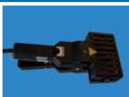
QSP 60LF plus