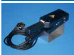
QSP 60 plus