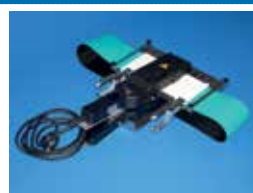
QSP 105 plus