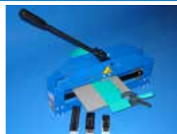
MFT 60 / MFT 130 / MFT 250