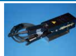
QSP 160 plus