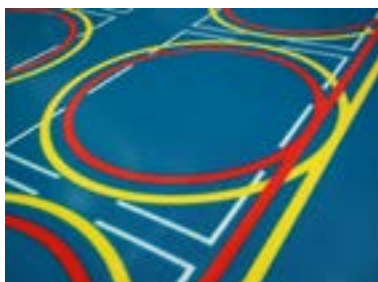
Taśma pozycjonująca Permaline U2: wyraźny, nieblaknący nadruk, równie wytrzymały, jak sama taśma