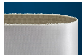
Correia equivalente do concorrente líder

*resultados obtidos após testes laboratoriais idênticos