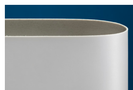
Correia antidesfiamento Ammeraal Beltech