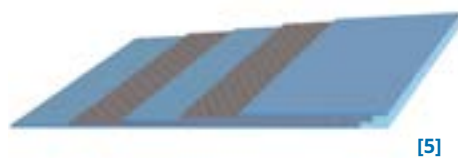
Protection de bord Amseal sur des bandes 2 plis avec revêtement 2 faces: [1] revêtement inférieur ; [2] tissu [3]; couche interne ; [4] revêtement supérieur [5]; bande Amseal

Avec l'Amseal les surfaces supérieure et latérale de la bande sont totalement protégées. Ainsi, les bandes deviennent plus faciles à nettoyer (sécurité alimentaire) et mécaniquement plus solides au frottement latéral (plus longue durée de vie).